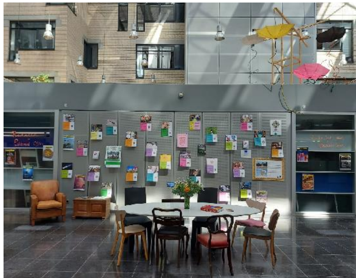
De basis van Leiden2022 in het Stadsbouwhuis

Na lange onderhandelingen met de Gemeente Leiden, Energiepark Leiden en Villex kon vanaf december het Stadsbouwhuis aan de Langegracht in gebruik worden genomen als kantoorruimte en uitvalsbasis voor het groeiende team, en als projectruimte voor Leiden2022. De ruimte (1000 m 2 ) op de begane grond wordt gedeeld met het Circulair Warenhuis, kunstenaars en jonge ondernemers. Op de verdiepingen is door Villex tijdelijke huisvesting ingericht voor 94 studenten.