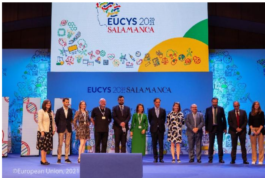
Titeloverdracht EUCYS in Salamanca

Op 19 september 2021 vond de 32e editie van de European Union Contest for Young Scientists (EUCYS) plaats in Salamanca, Spanje. Tijdens de Award Ceremony werd het stokje officieel overgedragen aan Leiden. De 33e editie van de van origine Nederlandse wedstrijd voor jong wetenschappelijk talent gaat daarmee voor het eerst sinds ruim 20 jaar weer in ons land plaatsvinden, van 13 tot 18 september 2022. Een delegatie van het team van Leiden2022 reisde naar Salamanca voor de officiële titeloverdracht.