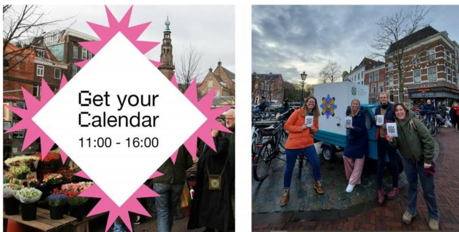
Vanaf 10 november worden overal scheurkalenders uitgedeeld

Op basis van de door velen bottom-up aangedragen 365 dagonderwerpen is een scheurkalender gemaakt die vanaf 10 november in een oplage van 44000 exemplaren is verspreid via markten, bibliotheken, buurthuizen, scholen, GGD-locaties, musea en andere (culturele) instellingen. Daarnaast werden de scheurkalenders via de Founding Partners verspreid.