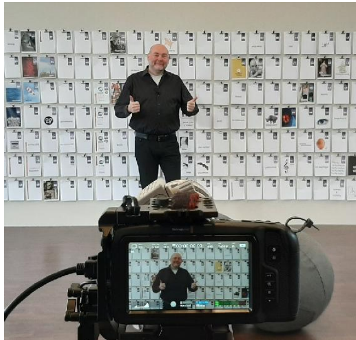
Livestream 4 februari: presentatie Playbook II

Het platform Leiden 2022 biedt alle deelnemers de mogelijkheid een kennisvolle waardensprong of een waardevolle kennissprong te maken.