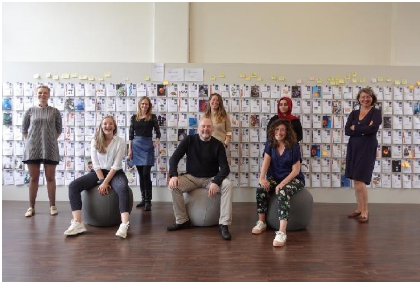
Team Leiden2022 zomer 2022

Het project Postbus71 is als opdracht ondergebracht bij het Citizen Science LAB in Leiden.