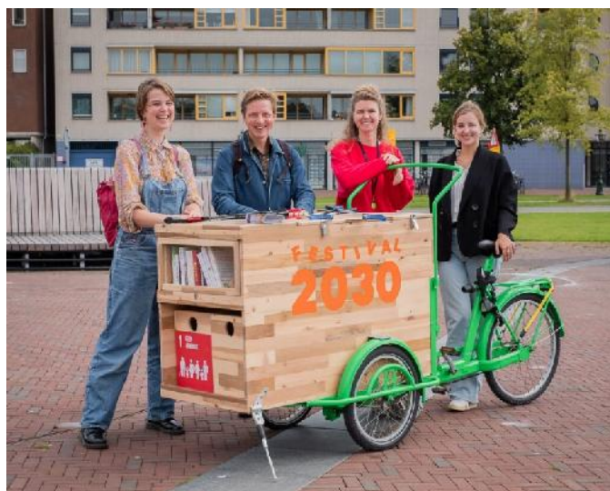
Het team van Stichting 2030

De Stichting 2030, die in 2020 werd opgericht met als doel om vanuit Leiden een nationale beweging op gang wil brengen rond de Sustainable Development Goals en waarmee door Leiden2022 een Memorandum of Understanding werd afgesloten, heeft in de zomer van 2021 een festival georganiseerd: https://stichting2030.nl/project/festival-2030-een-stadsbreed-festival-voor-duurzame-ontwikkeling/ . Vanuit Leiden2022 is op onderdelen meegedacht bij de ontwikkeling van het festival, dat mede als blauwdruk fungeerde voor het programma Kennis door de Wijken dat in 2022 wordt uitgevoerd.