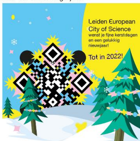
Kerstgroet december 2021

Net nu Leiden European City of Science 2022 op 1 januari écht zou beginnen, is Nederland opnieuw in lockdown vanwege het coronavirus. De afgelopen week hebben we alles op alles gezet om het programma aan te passen aan de huidige situatie. We kunnen nog niet volop genieten van de resultaten van alle voorbereidingen maar we kijken graag naar wat er wél mogelijk is.