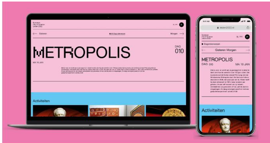
In november 2021 werd de nieuwe website gepresenteerd.

Het Twitter-account werd nieuw leven ingeblazen en had eind 2021 circa 720 volgers. Het LinkedIn-account dat in 2020 werd geactiveerd had eind 2021 circa 760 volgers. Het Instagram-account dat in 2021 werd geactiveerd had eind 2021 circa 550 volgers.