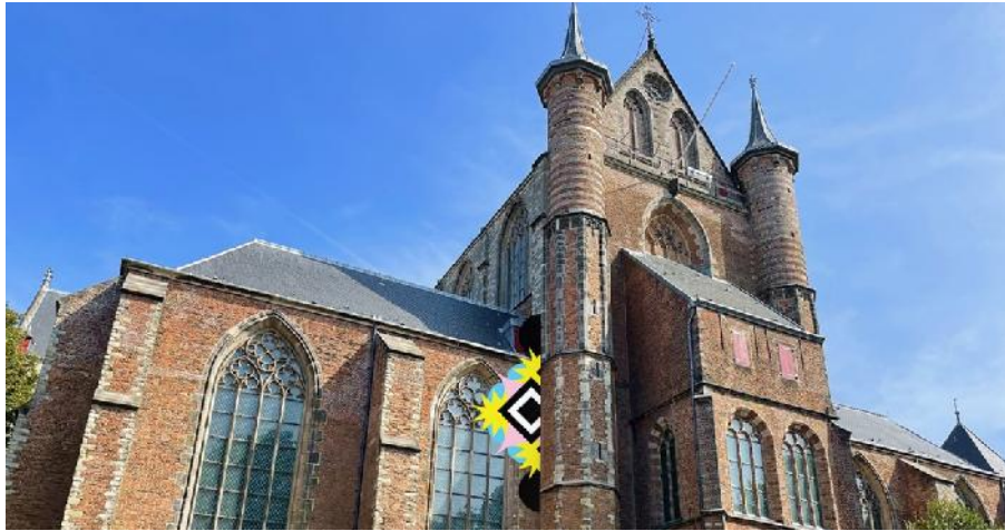
Campagnebeeld van Leiden European City of Science 2022