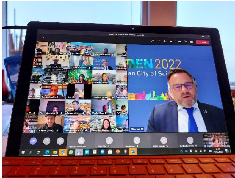
Infosessie voor gemeente Leiden over Kennis door de Wijken

enthousiasme was groot. Uit het grote aantal suggesties en mogelijkheden zijn 365 dagonderwerpen gekozen die op 1 augustus definitief werden vastgesteld.